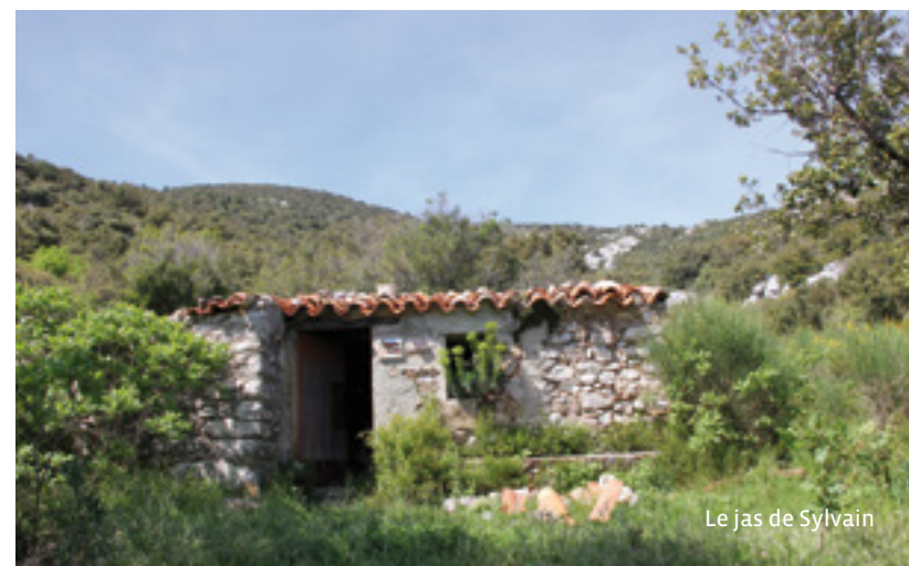
Le jas de Sylvain

Restauré en 1987 par l'Office National des Forêts, ce puits récupère les eaux d'infiltration du massif de la Sainte-Baume et a la particularité d'être en eau toute l'année. Comme les citernes, il servait à l'approvisionnement en eau des animaux mais également des hommes qui vivaient aux alentours. La corvée d'eau était principalement assurée par les femmes et les enfants parfois aidés d'un âne.