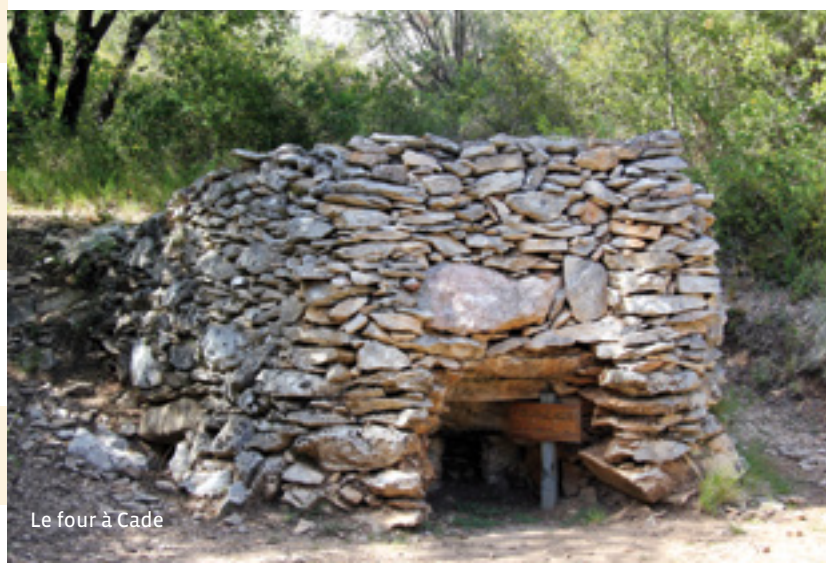
Le four à Cade